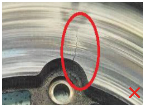
Surface fissurée de la pièce