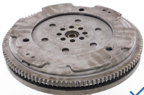
Pièce complète sans composants manquants ni endommagés