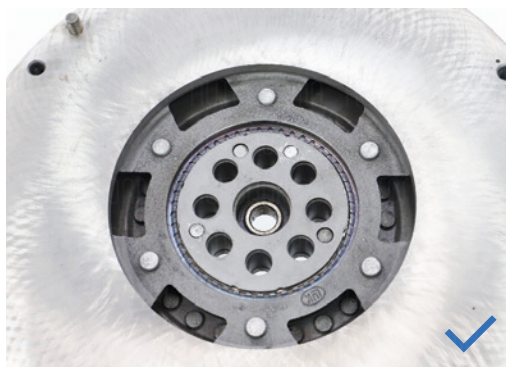
Poignées intactes après démontage