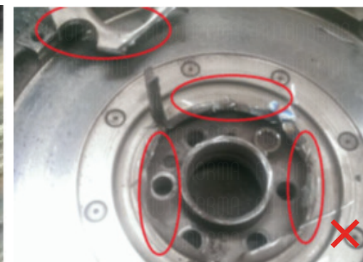
Domage après démontage