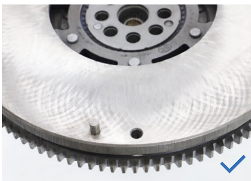
Surface de friction intacte